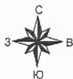
Схема расположения земельных участков на кадастровом плане территории

Утверждена постановлением администрации МОМР "Печора" от 19 ФЕВ 2024 № 203