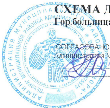
СХЕМА ДВИЖЕНИЯ ПО МАРШРУТУ №9/4 Гор.больница - ж/д вокзал - пл.Горького - п.Восточный